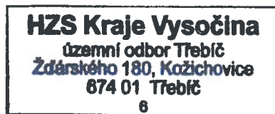
plk. Mgr. Pavel Maslák ředitel územního odboru

Posouzením předložené projektové dokumentace v rozsahu požárně bezpečnostního řešení dle ustanovení § 46 odst. 1 vyhlášky č. 246/2001 Sb., o stanovení podmínek požární bezpečnosti a výkonu státního požárního dozoru (vyhláška o požární prevenci), ve znění vyhlášky č. 221/2014 Sb., dospěl HZS Kraje Vysočina k závěru, že požárně bezpečnostní řešení splňuje obsahové náležitosti dle ustanovení § 41 vyhlášky o požární prevenci. Z obsahu posouzeného požárně bezpečnostního řešení vyplývá, že jsou splněny technické podmínky požární ochrany kladené na danou stavbu vyhláškou č. 23/2008 Sb., o technických podmínkách požární ochrany staveb, ve znění vyhlášky č. 268/2011 Sb.