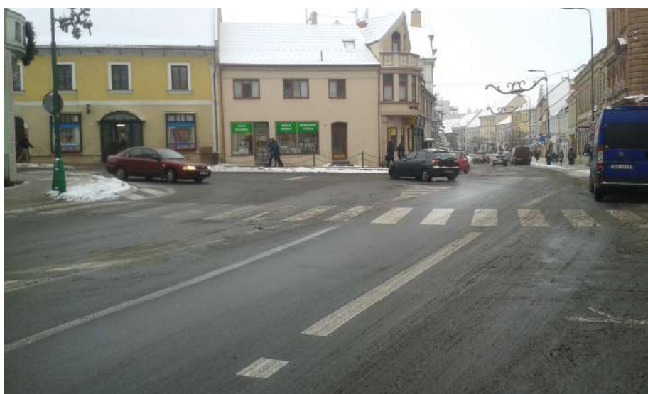
Obr. 8 Pohled na křižovatku z ulice Smila Osového