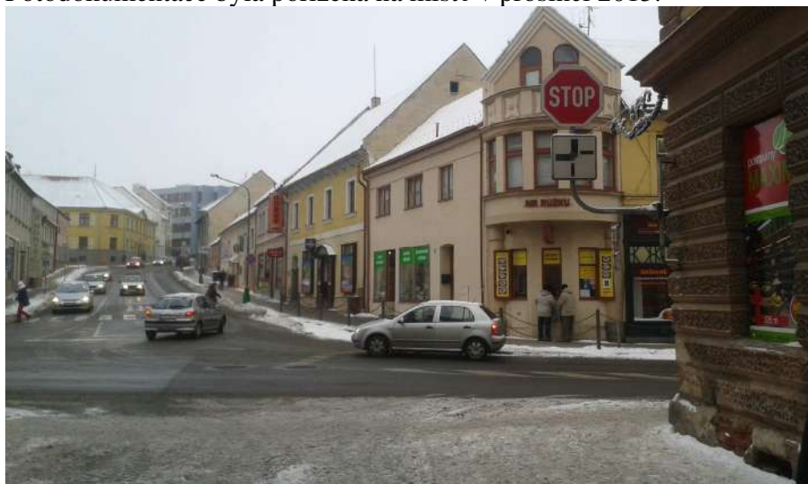
Obr.1 Pohled z ulice Soukenická

Fotodokumentace byla pořízena na místě v prosinci 2015.