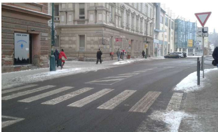
Obr. 15 Pohled na křižovatku z Jejkovské Brány