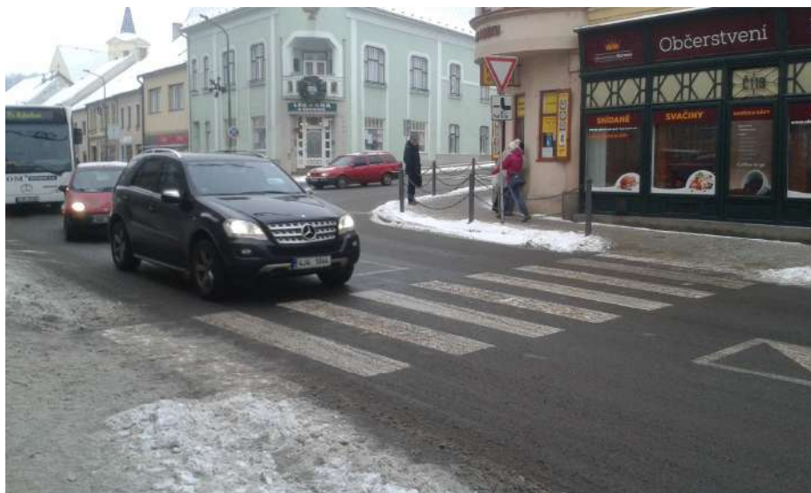
Obr. 16 Pohled na křižovatku z Jejkovské Brány