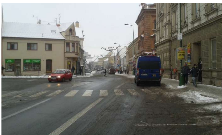
Obr. 9 Pohled na křižovatku z ulice Smila Osového