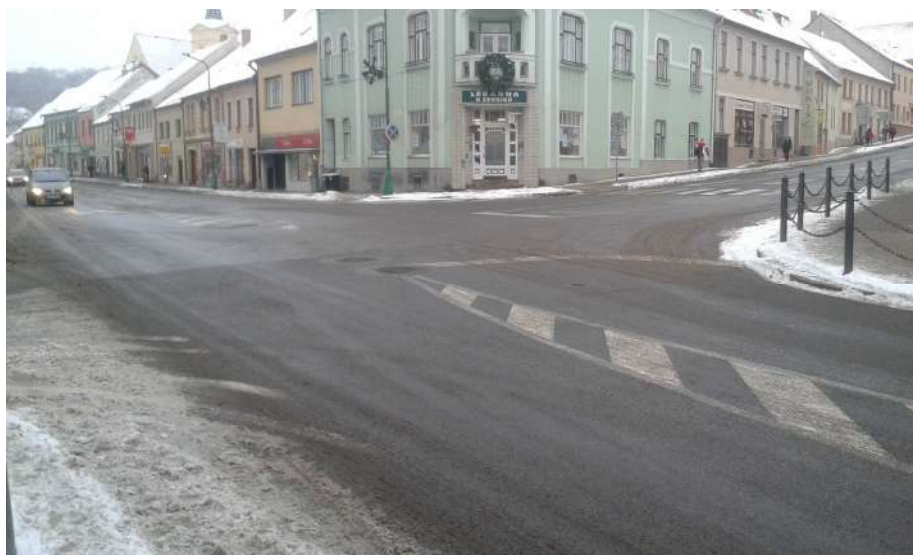
Obr. 17 Pohled na křižovatku z Jejkovské Brány