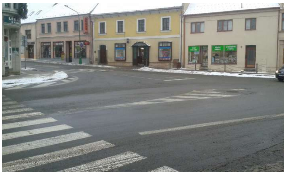
Obr. 6 Pohled na křižovatku od hlavní pošty