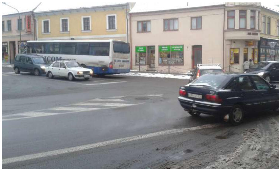
Obr. 4 Pohled na křižovatku od hlavní pošty