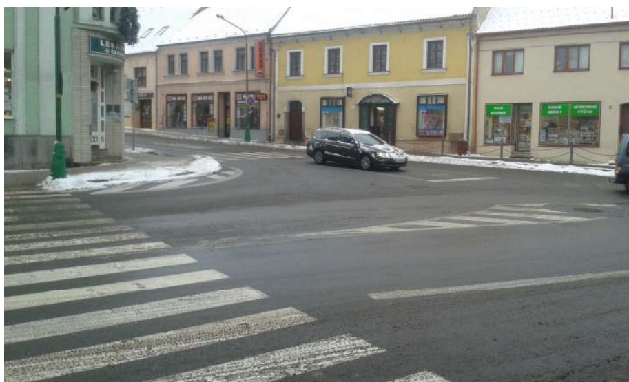
Obr. 5 Pohled na křižovatku od hlavní pošty