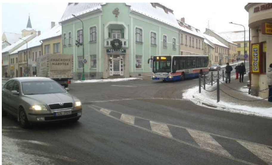
Obr. 18 Pohled na křižovatku z Jejkovské Brány