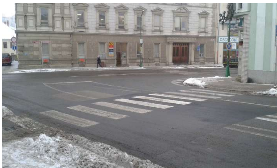
Obr. 12 Pohled na křižovatku z ulice Bedřicha Václavka