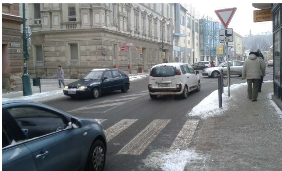
Obr. 14 Pohled na křižovatku z Jejkovské Brány