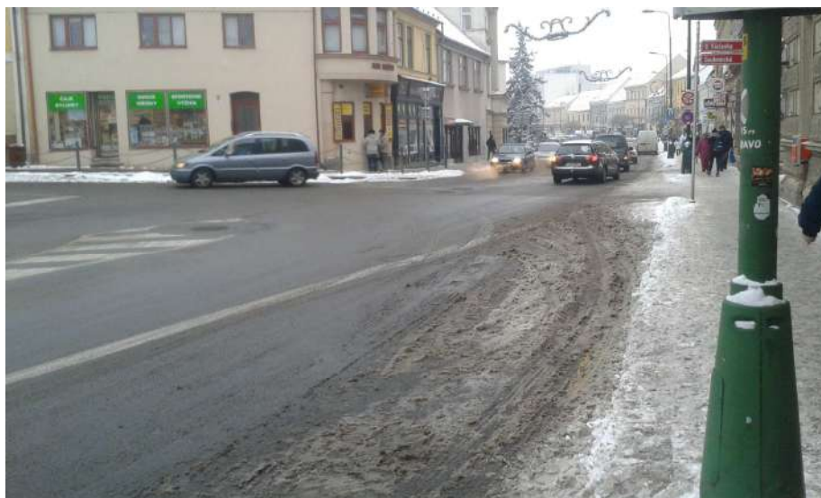
Obr. 7 Pohled na křižovatku z ulice Smila Osového