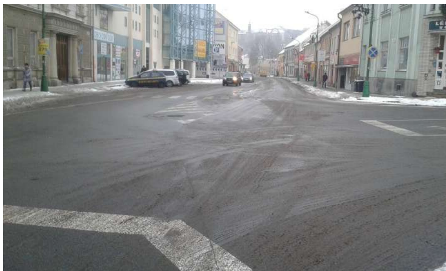
Obr. 13 Pohled na křižovatku z Jejkovské Brány