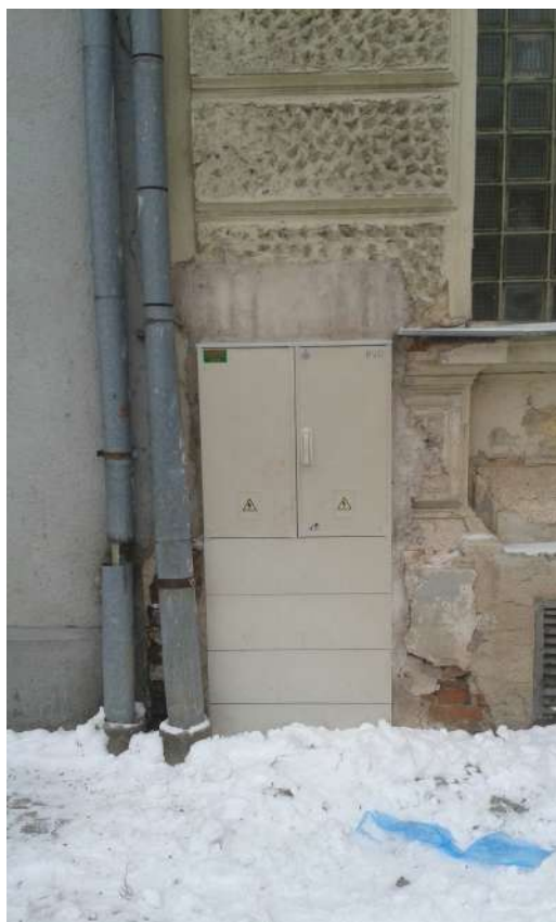
Obr. 19 Pohled na rozváděč veřejného osvětlení