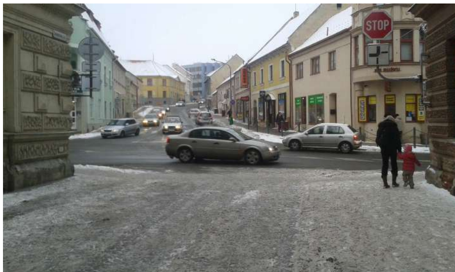
Obr.2 Pohled z ulice Soukenická