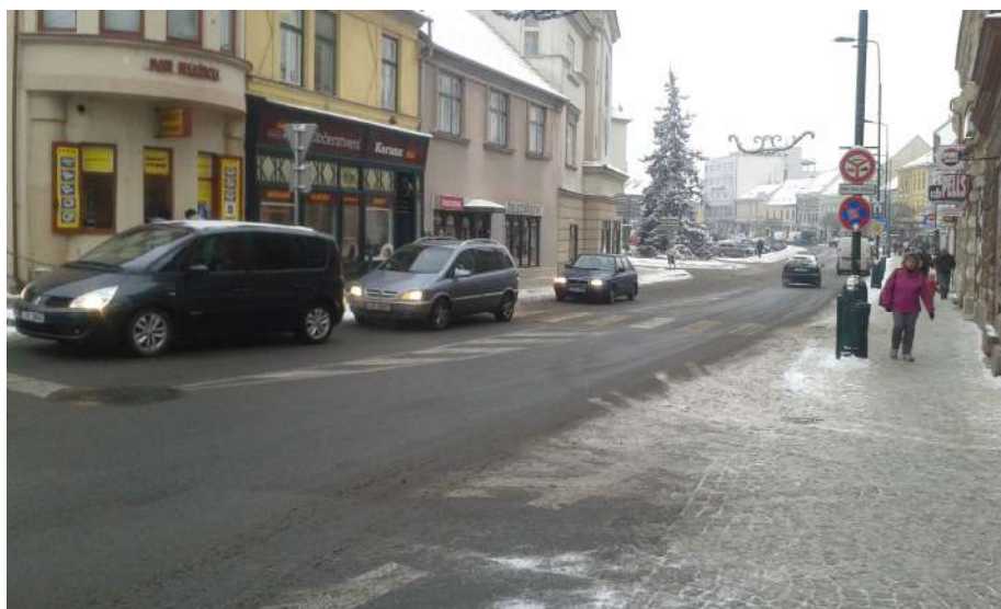
Obr.3 Pohled do Jejkovské Brány na Karlovo náměstí