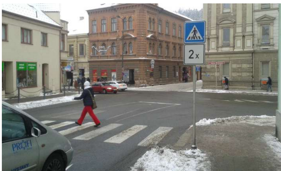
Obr. 11 Pohled na křižovatku z ulice Bedřicha Václavka